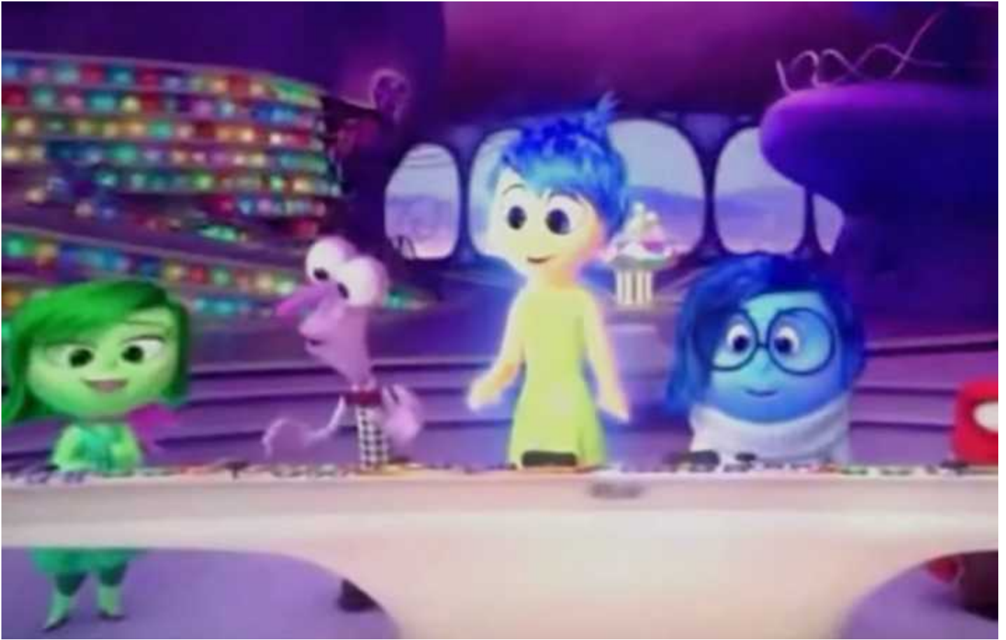
成年人的Headquarter則由一位首領發號司令，例如媽媽的首領是阿愁